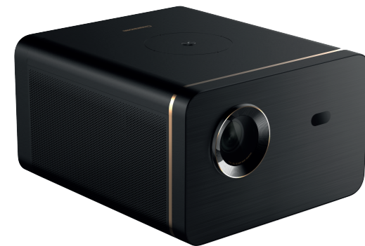
MULTIMEDIA PROJECTOR МУЛЬТИМЕДИА ПРОЕКТОР CS-E3.SG